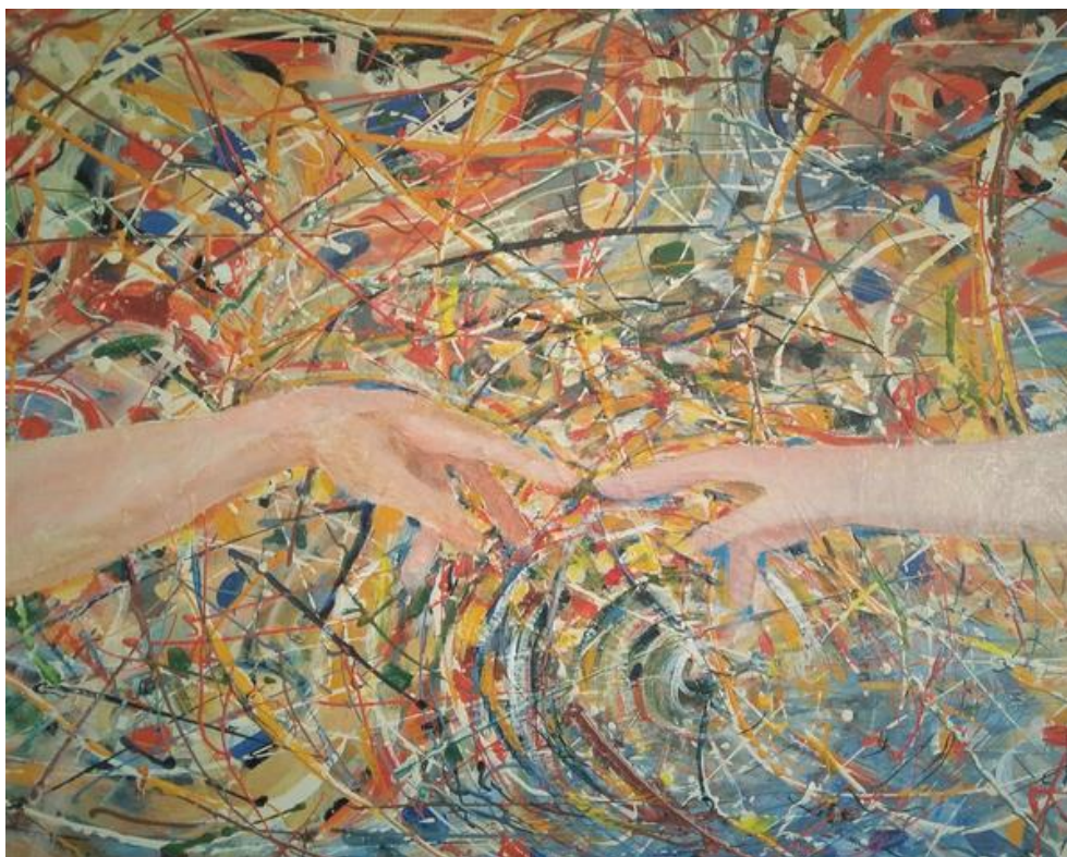
Éric Pichon : « Distanciation sociale » acrylique sur toile 50x70– Toile éphémère